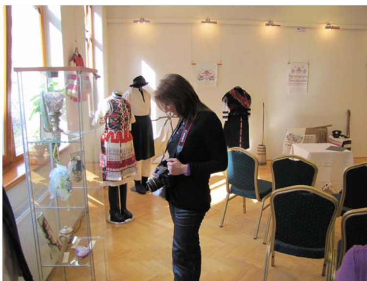
A lap első számában bemutatott tárgyak vitrinje előtt