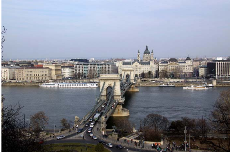
A rendezvény helyszínéül szolgáló Budapest gyönyörű panorámája