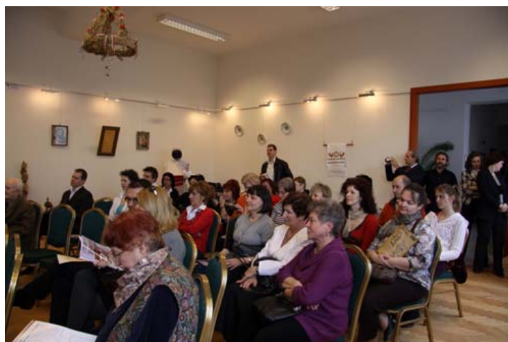
Az újság bemutatása